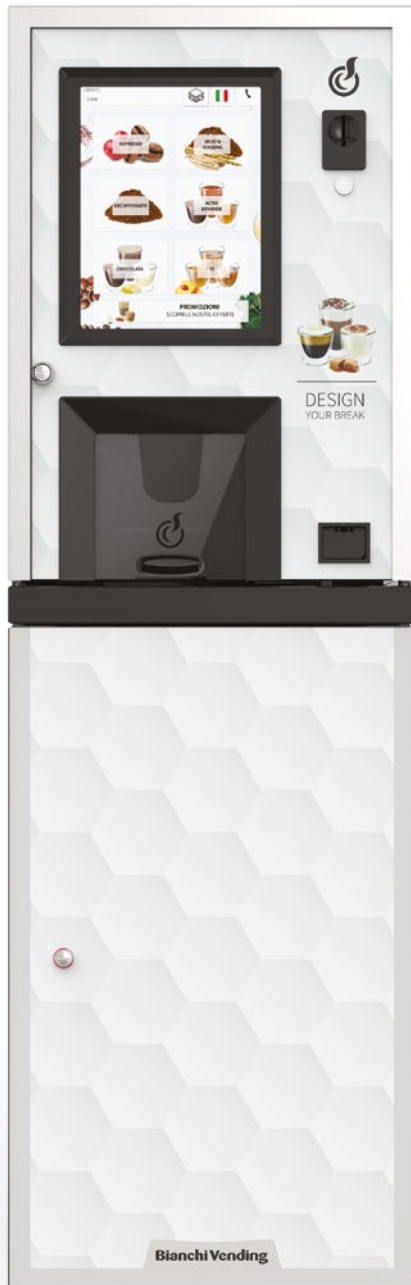
LEI250 TOUCH15" + MUEBLE + KIT ADHESIVO CON GRÁFICO "DESIGN YOUR BREAK" (OPCIONAL)